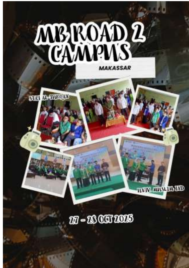
Gambar III.4 Infografis Kegiatan MB Road to Campus

pemikiran kritis dan solusi inovatif dalam menghadapi tantangan moderasi beragama di masa depan.