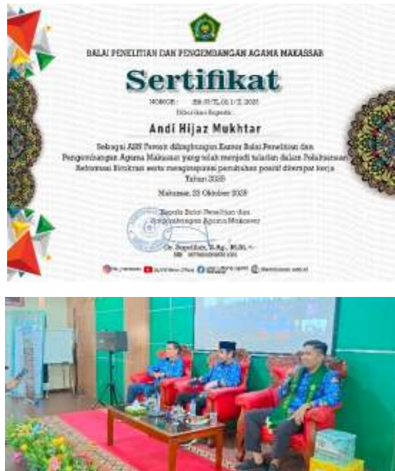
Gambar III.13 ASN Teladan/Inspiratif