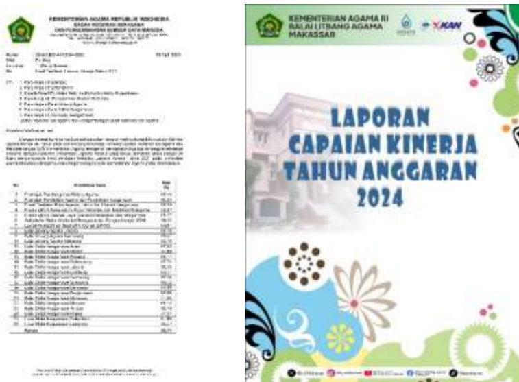
Gambar III.8 Laporan Capaian Kinerja Tahun Anggaran 2024

Ke depan, penguatan tetap diperlukan pada aspek analisis—terutama dalam menajamkan uraian faktor penyebab deviasi, pembelajaran kinerja, dan rekomendasi perbaikan—agar laporan kinerja tidak hanya “sesuai standar”, tetapi juga semakin bernilai sebagai dokumen manajerial untuk pengambilan keputusan.