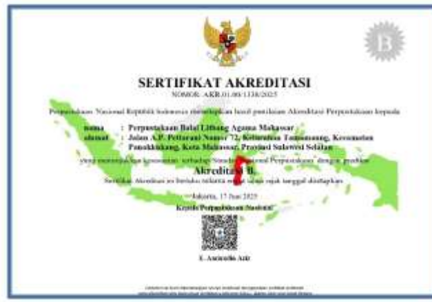
Gambar III.16 Akreditasi Perpustakaan

Secara keseluruhan, hasil analisis capaian kinerja berdasarkan indikator menunjukkan bahwa sebagian besar indikator kinerja Balai Litbang Agama Makassar pada Triwulan IV Tahun 2025 telah tercapai sesuai dengan target yang ditetapkan, bahkan beberapa indikator menunjukkan capaian yang melampaui target. Capaian tersebut mencerminkan efektivitas pelaksanaan perencanaan dan pengendalian kinerja yang dilakukan secara konsisten sepanjang tahun anggaran, meskipun dilaksanakan dalam konteks tahun pertama implementasi Rencana Strategis 2025–2029, masa transisi kelembagaan, serta adanya kebijakan efisiensi anggaran.