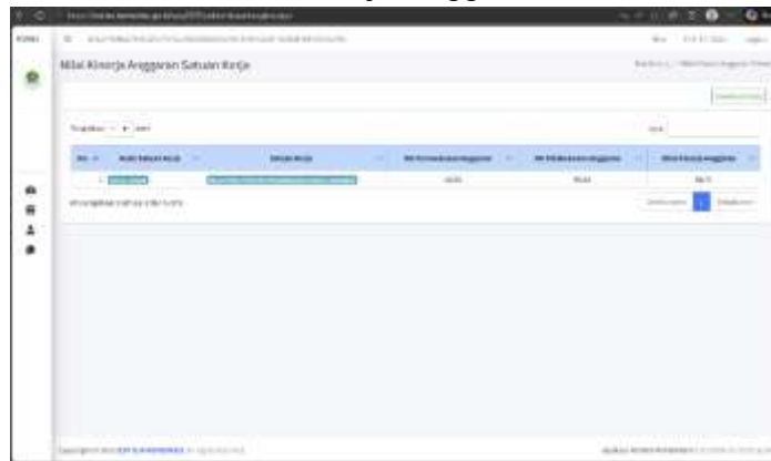
Gambar III.7 Nilai Kinerja Anggaran

Indikator ini menjadi perhatian penting untuk penguatan perencanaan dan pengendalian anggaran pada periode berikutnya, khususnya dalam meningkatkan keselarasan antara perencanaan kinerja dan perencanaan anggaran sejak awal tahun.