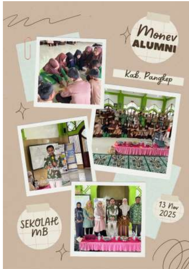
Gambar III.6 Infografis Kegiatan Monitoring Evaluasi Alumni Sekolah Penguatan MB

terhadap keberagaman dan Membangun kolaborasi dari latar belakang yang berbeda.