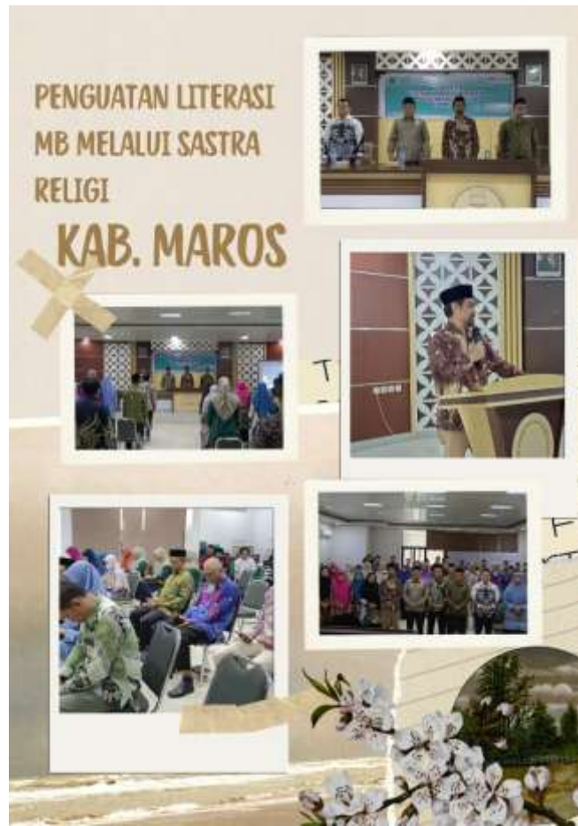
Gambar III.1 Infografis Kegiatan Penguatan Literasi MB melalui Sastra Religi