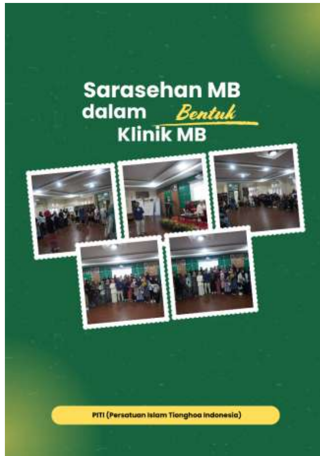
Gambar III.2 Infografis Kegiatan Sarasehan MB dalam Bentuk Klinik MB