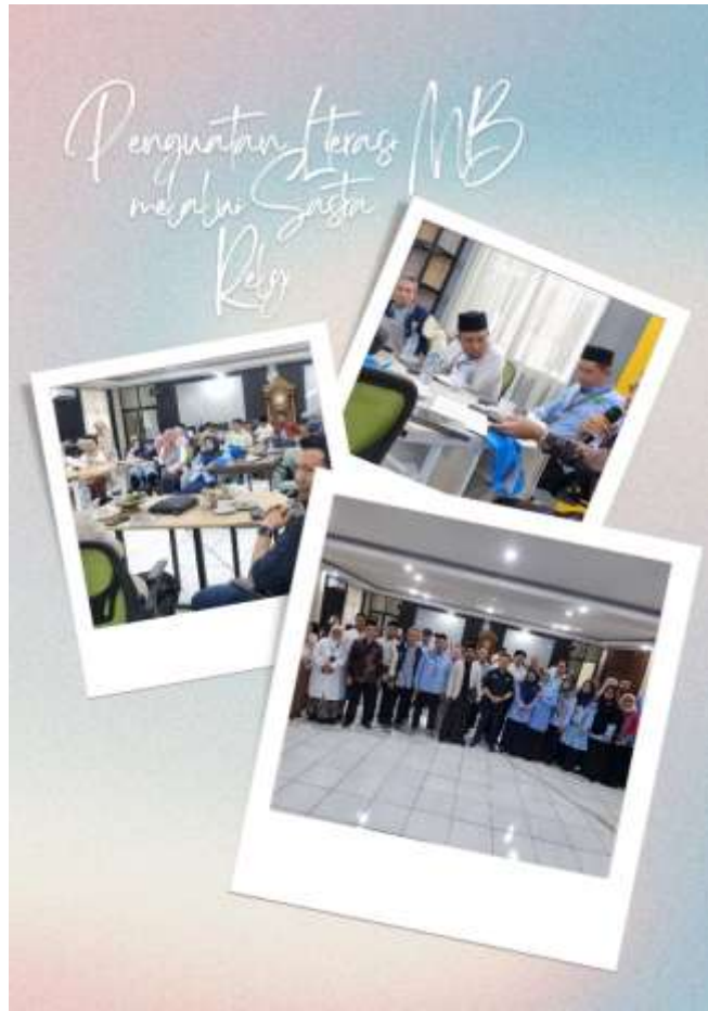
Gambar III.3 Infografis Kegiatan Penguatan Literasi MB melalui Sastra Religi