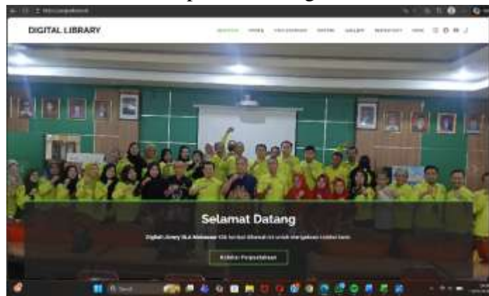
Gambar III.15 Perpustakaan Digital

Ke depan, indikator ini dapat ditingkatkan tidak hanya melalui penambahan koleksi digital, tetapi juga melalui penguatan platform akses, peningkatan kualitas metadata, dan strategi pemanfaatan koleksi oleh pengguna agar dampaknya lebih nyata.