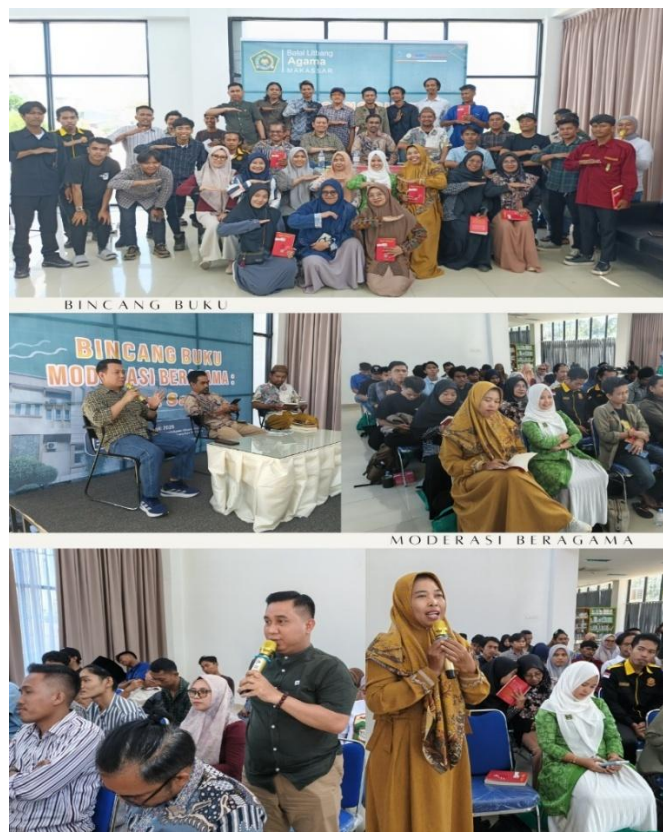
Gambar 5 Infografis Kegiatan Bincang Buku Moderasi Beragama Balai Litbang Agama Makassar Tahun Anggaran 2025

dalam buku tersebut. Dengan menghadirkan narasumber yang kompeten dan pembahas yang memiliki pemahaman mendalam, kegiatan ini diharapkan dapat menciptakan ruang dialog yang sehat, terbuka, dan kritis antara penulis, pembaca, dan masyarakat luas. Melalui kegiatan ini pula, diharapkan tumbuh semangat untuk terus membaca, menulis, dan berdiskusi secara produktif, sehingga budaya literasi di tengah masyarakat semakin berkembang dan menjadi bagian penting dalam kehidupan sehari-hari.