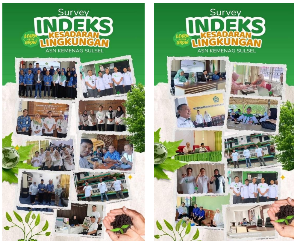
Gambar 6 Infografis Kegiatan Indeks Kesadaran Lingkungan Balai Litbang Agama Makassar Tahun Anggaran 2025