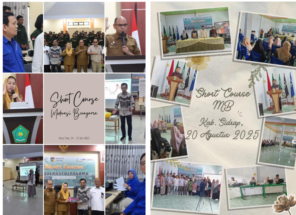
Gambar 8 Infografis Kegiatan Short Course MB Balai Litbang Agama Makassar Tahun Anggaran 2025

ini, mahasiswa akan memiliki perspektif yang lebih luas dan inklusif, mampu menjadi agen-agen perdamaian di lingkungan kampus dan masyarakat, serta turut berkontribusi dalam mewujudkan harmoni sosial di Indonesia. Program ini juga diharapkan dapat menjadi model bagi pengembangan inisiatif serupa di berbagai perguruan tinggi lainnya.