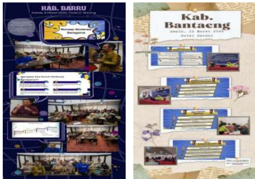
Gambar 5 Infografis Sosialisasi Diseminasi MB berbasis Komunitas Balai Litbang Agama Makassar Tahun Anggaran 2025