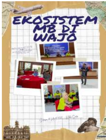
Gambar 6 Infografis Ekosistem MB Balai Litbang Agama Makassar Tahun Anggaran 2025