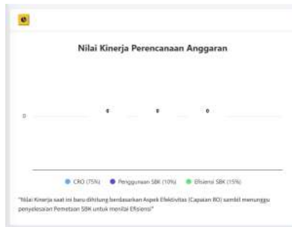
Gambar 2 Eviden Sasaran Kegiatan 4 Perkin BLA Makassar Tahun Anggaran 2025

yang menjadi target adalah Lap. Evaluasi Renstra 2020 – 2024; Renstra 2025 – 2029; RKT 2025; Perkin 2025; DIPA 2025; RKA-KL Pagu Alokasi Anggaran dan RKA-KL Pagu Anggaran. Sampai dengan Triwulan 1, dokumen yang belum terealisasi adalah Renstra 2025 – 2029. Indikator kinerja kegiatan yang belum memperoleh realisasi disebabkan nilai kinerja perencanaan yang ada dalam SMARTDJA masih diangka 0.